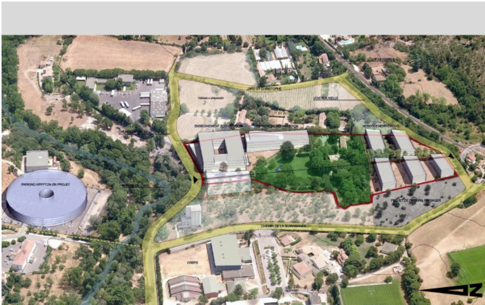
Jean – Michel BATTESTI Architectes et Associés